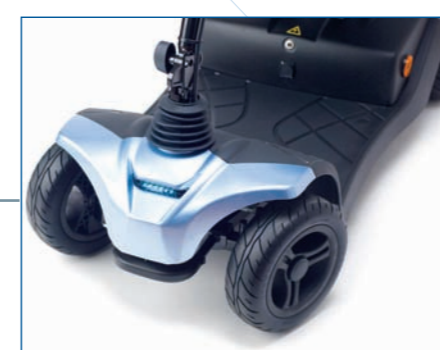
Luz led delantera