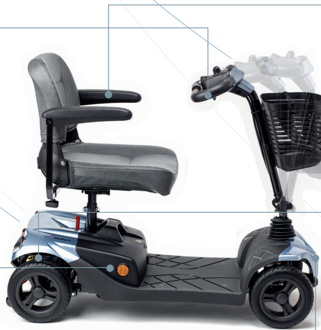
Columna de conducción