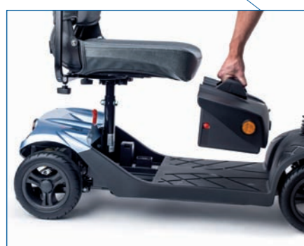
Baterías extraíbles para facilitar su recarga